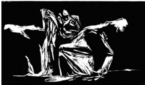
Figura 1 – Sem título (2017) – da série de gravuras Xilocoreo – grafo – de Edson Possamai

que são apresentadas ao longo deste estudo.