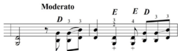
Figura 1 – Trecho do Prelúdio VI – Sonhando com dedilhado proposto por Valle usando a mão direita (D) e esquerda (E).

D = mão direita E = mão esquerda p = polegar m = médio