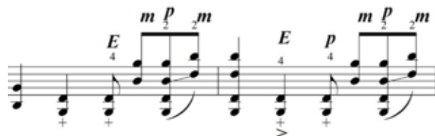
Figura 2 – Dedilhado proposto por Valle usando a mão direita (D) e esquerda (E) e também o polegar (p) e médio (m) da mão direita.

A partir desse dedilhado, de uma maneira geral, a (D) é a principal condutora sonora, teria a função do arco, de produzir o som. O (p) aparece também para produzir o som, mas principalmente na realização de acordes. Indicar o (p) para realizar os acordes mostra uma boa solução encontrada por Valle já que é um dedo que possibilita acordes mais sonoros e com um peso maior. O (E) aparece geralmente em notas de cordas soltas com caráter de preenchimento harmônico. Devido a essa postura incomum, reiteramos a importância do foco na questão da afinação ao longo do processo de estudo.