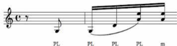
Figura 9 – A última semicolcheia deve ser executada com o médio (m) “para cima” (segunda e primeira cordas), também com um acento.

Depois de executar com PL para “baixo” (segunda e primeira cordas), a última semicolcheia deve ser executada com o médio (m) “para cima” (segunda e primeira cordas), também com um acento 9 :