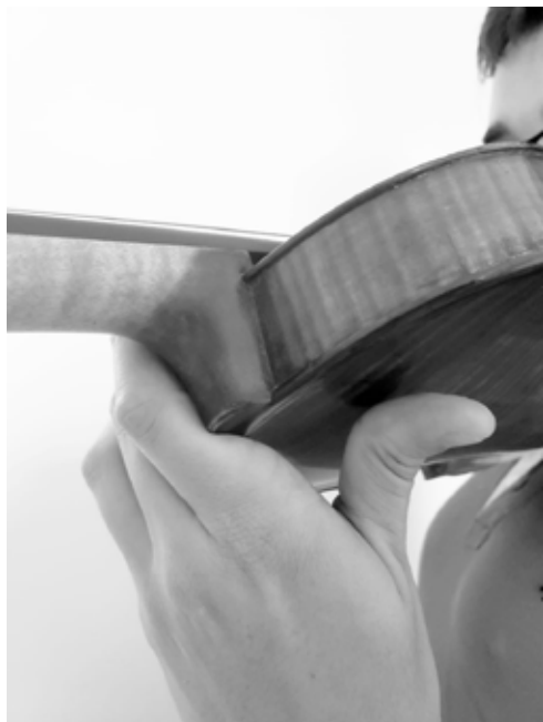
Figura 17 – Batida no fundo do instrumento com o osso da segunda falange do polegar esquerdo (flexibilidade de dedo).

como ilustra o vídeo disponibilizado 14 .