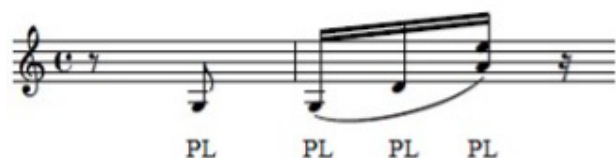
Figura 8 – Com o polegar desde a anacruse até a terceira semicolcheia (tocando junto a I e II cordas)

Depois de executar com PL para “baixo” (segunda e primeira cordas), a última semicolcheia deve ser executada com o médio (m) “para cima” (segunda e primeira cordas), também com um acento 9 :