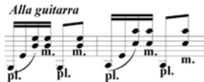
Figura 6 – Batuque de viola

Outra questão que surge nesse Prelúdio , ainda referente ao Alla Guitarra , é a execução do ritmo de batuque de viola. Segue a figura identificada como batuque de viola: