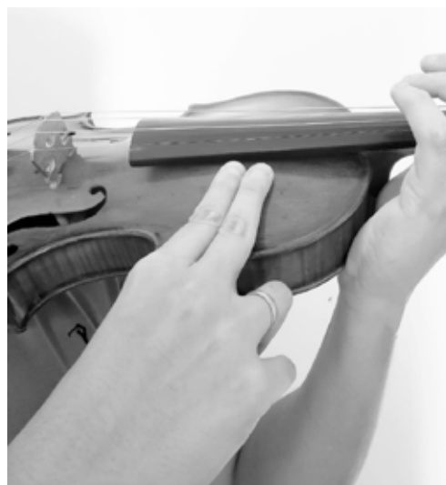
Figura 16 – Batida no tampo com as falanges do indicador e médio direito em uma região central.

primeira questão consiste em tomar decisões sobre como bater no tampo e no fundo para imitar o tambor. Após a experiência do autor principal em performance , a busca foi por um som mais projetado, mas com o cuidado de não machucar o violino. Quando se batia em cima, perto da “prima corda” (Valle), percebia-se que não fazia tanta diferença sonora bater com um dedo ou dois. A escolha foi bater com os dois dedos (índice e médio da mão direita), com todas as falanges e bem próximo ao centro do instrumento.