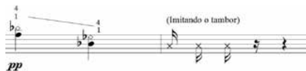
Figura 21 – Representação da manifestação do espírito