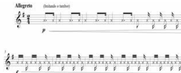
Figura 18 – Introdução do Prelúdio XVIII – Pai João

A imitação inicial do tambor no tampo do instrumento abre possibilidade para muitas discussões e um alto teor imaginativo do intérprete a partir da leitura da bula interpretativa, principalmente se levarmos em consideração a indicação de Valle de como imitar o tambor no tampo do instrumento 16 :