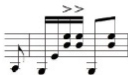
Figura 10 – Ritmo do batuque de viola

Ao realizar esses acentos, o objetivo é o de tornar a figura mais próxima das características executadas pelos violeiros: