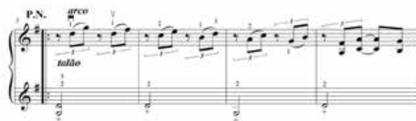
Figura 24 – Evocação da viola caipira no pentagrama inferior e evocação de aves ou violeiros no pentagrama superior. Também se observa a preferência pelos dedos 2 e 3 na realização dos pizzicati de mão esquerda para uma melhor reverberação.

Já em posição normal e com arco, o pizzicato de mão esquerda estabelece uma evocação do violão enquanto no pentagrama superior há a evocação do violeiro/aves – as cordas duplas talvez representem o momento em que as aves cantam em casal. A voz de baixo em cordas soltas é feita de forma que essas notas adquiram uma boa ressonância, através dos dedos dois e três na execução do trecho, no qual acontece a realização de pizzicato de mão esquerda simultaneamente com a melodia 20 .