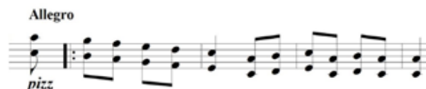
Figura 3 – Compassos iniciais com técnica Alla Guitarra no Prelúdio XIV – A Porteira da Fazenda e a dificuldade para evitar esbarras nas cordas

O Prelúdio XIV – A Porteira da Fazenda , assim como no Prelúdio anterior, também faz uso da técnica Alla Guitarra . Assim como apresentado, é preciso atenção com a afinação e com a questão se tocar “limpo”, ou seja, sem esbarrar em outras cordas nessa relação com os instrumentos, exemplificado abaixo: