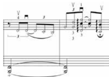
Figura 25 – Uso dos harmônicos para possivelmente evocar a ave

A característica onomatopaica está presente não somente na evocação da viola caipira, mas na imitação da ave e o uso de harmônicos evidencia ainda mais essa característica: