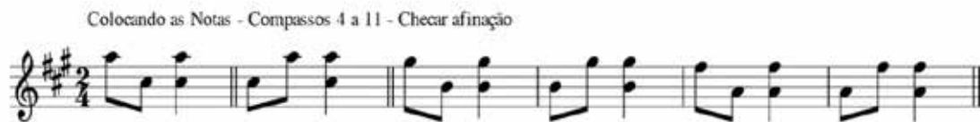
Figura 5 – Exercício para a colocação das notas

a nota de cima, seguido da nota de baixo e em seguida as duas juntas pode colaborar para fixar a posição correta da forma de mão.