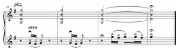
Figura 26 – Harmônicos evocando a ave e/ou violeiros e os acordes do pentagrama superior evocando a viola caipira.

ma de cima, com a evocação da viola caipira, com os harmônicos que representam o canto das aves/violeiro sendo representados no pentagrama de baixo.