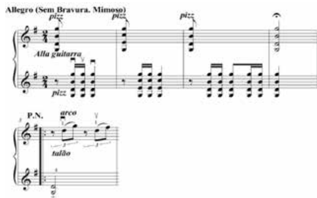
Figura 23 – Imitação da viola caipira através da técnica alla guitarra e intervalos de terças e sextas

Identifica-se a evocação da viola caipira na introdução. Valle determina que essa introdução seja a alla guitarra e no c.5 retorne para a posição normal 19 . Segue a introdução Alla Guitarra com imitação da viola caipira, com os intervalos em sextas: