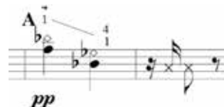
Figura 20 – Supostos fogos de artifícios (que agora sabemos ser a representação da incorporação de um espírito) com batida no tampo (xx) representando o tambor

Outro momento de desafio, possibilidades e aprendizado para o estudante é o momento da incorporação de um espírito, representada pelo glissando descendente em harmônicos artificiais. Até recentemente, pensávamos no glissando seguido de batida no tampo como uma suposta evocação de fogos de artifícios, o que havia sido elucidada pelo filho de Valle, Sr. Guatemoc Valle (durante uma visita que ocorreu quando da pesquisa de mestrado do autor deste artigo), e que ocorre no início da seção A.